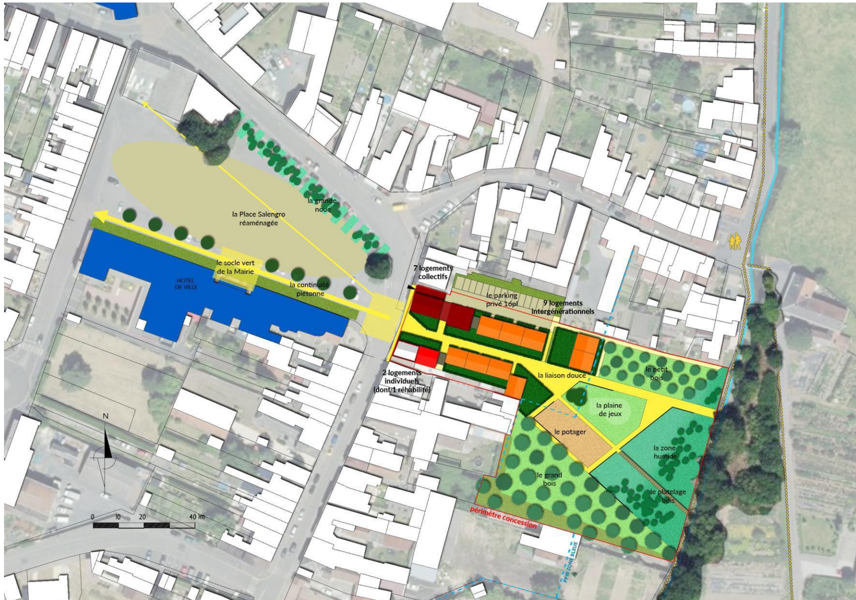
Plan masse de l'opération - AVP